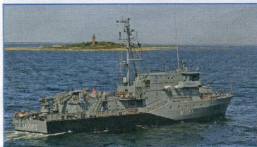
Das Minensuchboot Bad Bevensen in voller Fahrt.