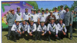
Die Marinekameraden bei ihrem Besuch auf dem Bevenser Schützenfest.